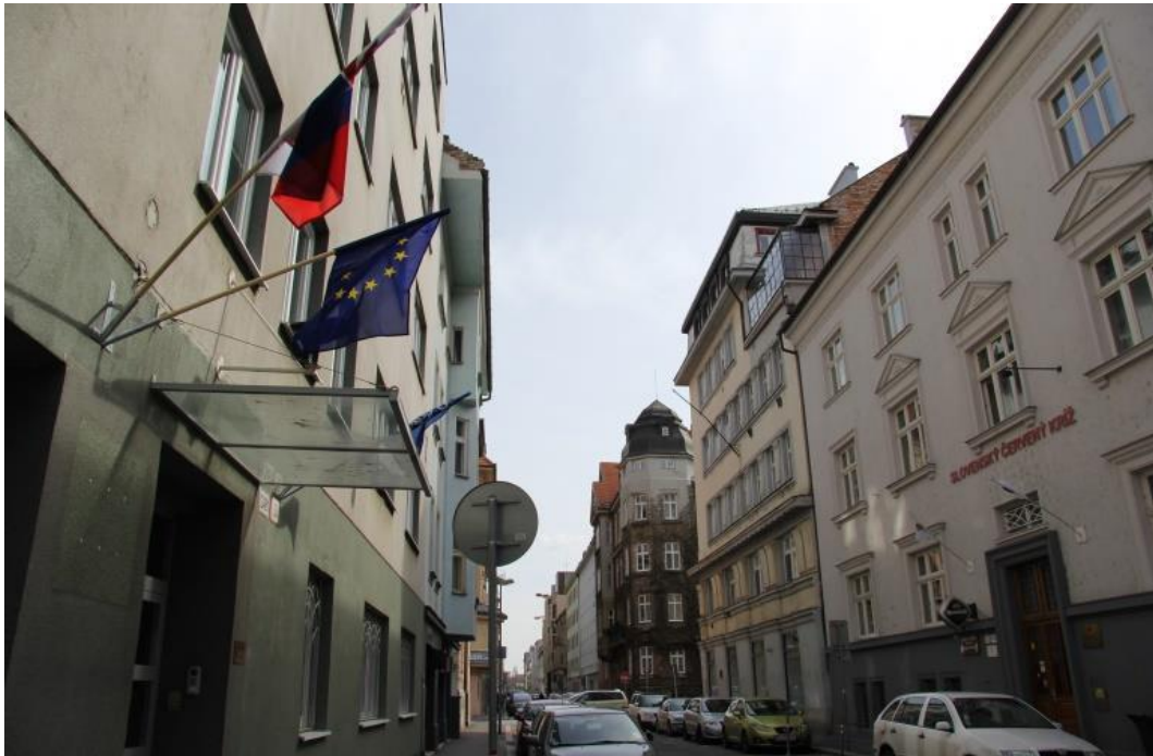
Kancelária verejného ochrancu práv, Gröslingova 35, 811 09 Bratislava – Staré mesto